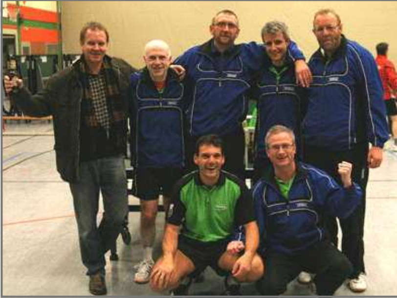
Der Durchbruch - Im 6. Spiel der erste Sieg. Und das gleich mit 9:3 gegen TV Hude, immerhin Tabellenzweiter zur Halbserie. So wollen wir in der Rückserie öfters jubeln.

Entscheidend wird aber auch sein, in jedem Spiel mit der möglichst besten Mannschaft an den Start zu gehen. Zumindest in den Spielen gegen die Spvg. Oldendorf (4:9) und den TTSC Delmenhorst (6:9) wurden vielleicht wichtige Punkte liegen gelassen, weil wichtige Spieler kurzfristig ausfielen.