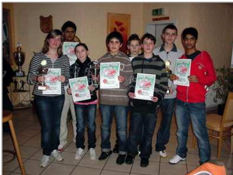
Sieger und Platzierte im Clubheim