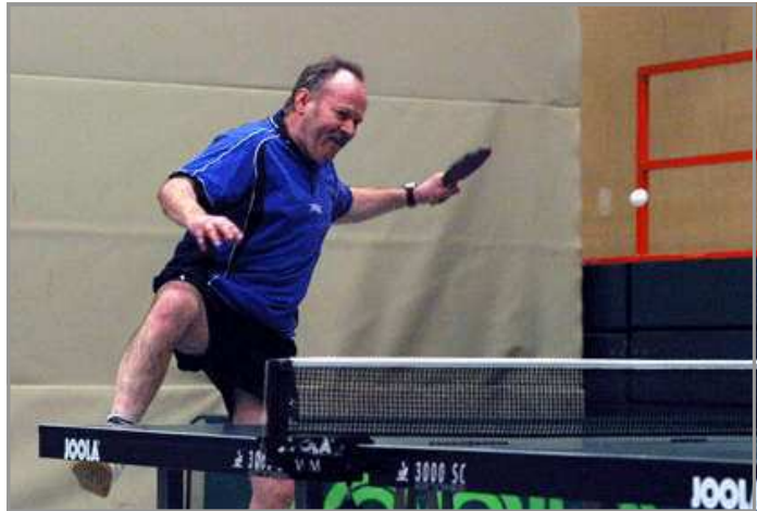
Horst - der Überflieger!

ben werden. Nun noch schlechter für die Gegner auszurechnen, weil ständig am rotieren, konnte die FÜNFTE die Konkurrenz nahezu überrollen. Mit 9:2 (Campemoor), 9:3 (Hollage) und 9:4 (Rieste) wurden die Mannschaften, mit denen wir noch in der Hinrunde die Punkte teilen mussten, klar und sicher geschlagen. Neben der zweiten Niederlage gegen Fürstenu II (klare Überflieger) mussten wir noch ein weiteres Mal gegen Ueffeln gratulieren, allerdings schon für die Relegation qualifiziert und deshalb nicht in Bestbesetzung angetreten. Das ergab im Ergebnis einen sicheren