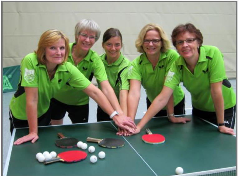
The same procedure as every year - SVC Damen