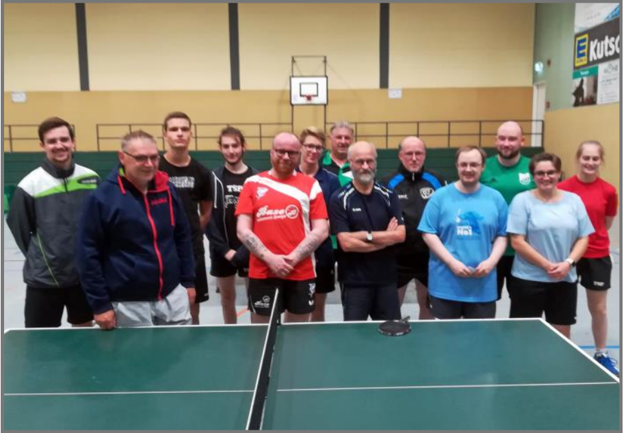
Die Teilnehmer des ersten TTVN-Races in Belm

++ ++ ++ ++ ++ ++ ++ ++ ++ ++ ++ ++ ++ ++ ++ ++ ++