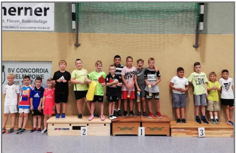
Die Sieger des Rundlaufteamcups