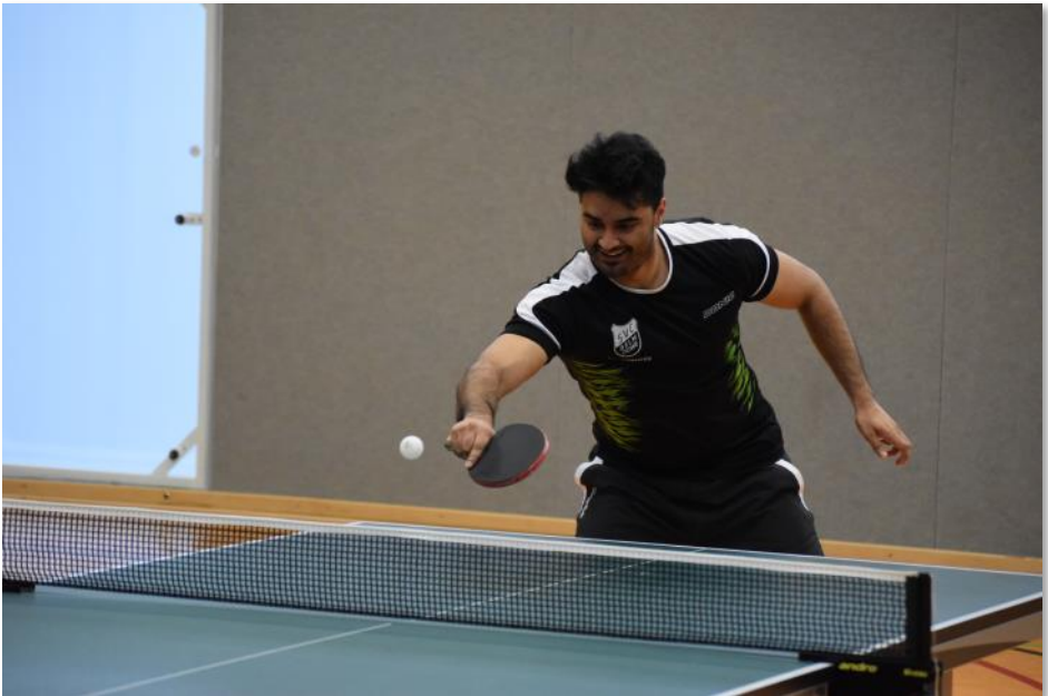
Glaubt an den Klassenerhalt der ersten Herrenmannschaft in der 1. Bezirksklasse - Humair