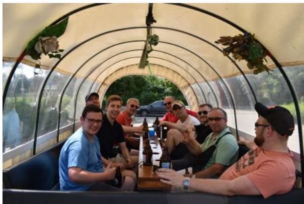
Startschuss für eine Tour durch's Belmer Umland